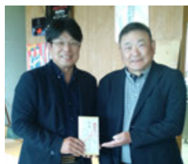
報告：小山会員家族委員長 写真：藤澤克彦さん・西沢徹さん