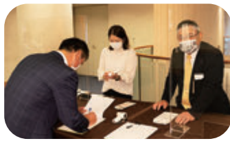
今年度最後の受付です。