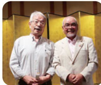
5月の誕生記念品贈呈