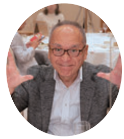
来年度はヨロシク!!