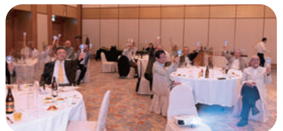
みなさん、真剣です!!