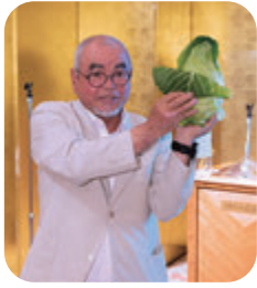
優賞者には、会長手作りの のトンガリキャベツ