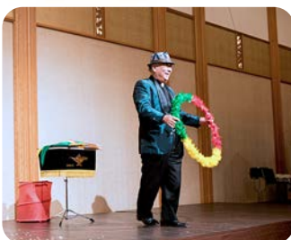
小さな輪が大きな輪に