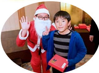
今年のサンタも男前です