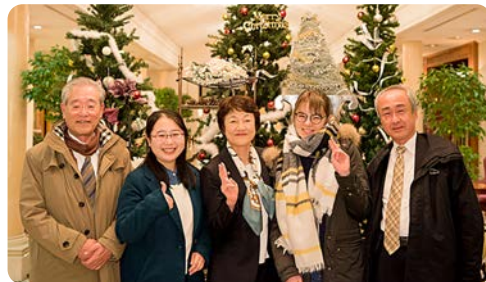
飯田パパと畢奇さん エオリアさんと坂本パパ