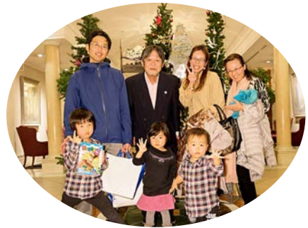
「仲間と共に」いいですね！