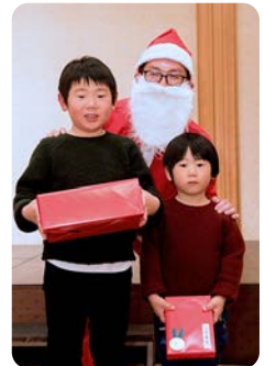
何ももらったかな？