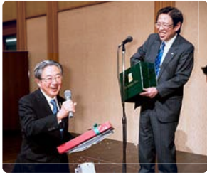
何が当たったかわかりませんがうれしいです