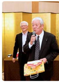
皆さんお楽しみ いただけましたか？