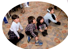
どうなってるんだあ？