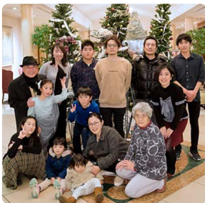
お孫さん達の成長ぶりにびっくりです。