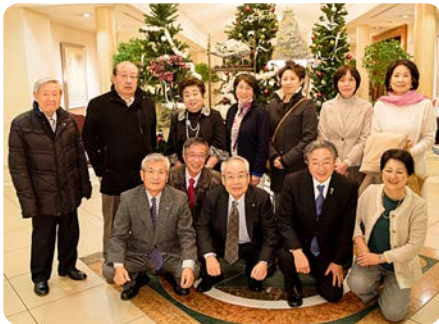
同級生はいいもんだ