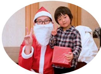
カメラ目線でピース