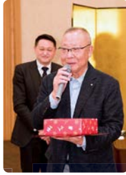
来年もいい年にしたいです