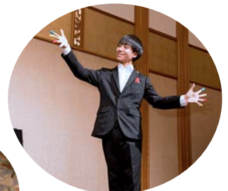
お孫さんも見事な手さばき