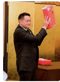
は〜い 当たりましたよ