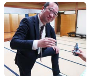
会報当番お疲れ様です まっ一杯どうぞ！