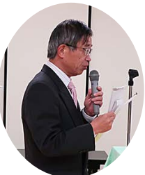
皆様ご協力 ありがとうございます