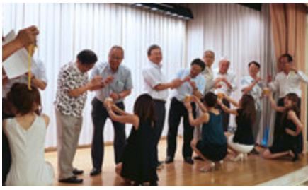
ビール早飲みスタート