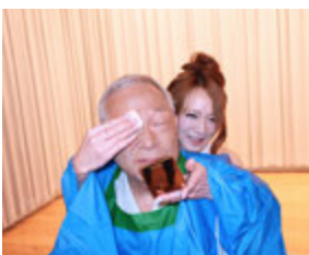
お姉さんもっと優しくして下さい。 そご目なんですけど…