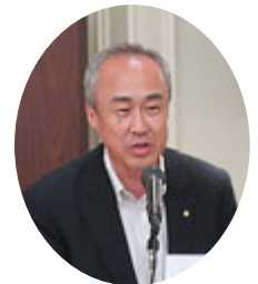
ニコBOXご協力 ありがとうございます