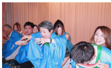
お茶でも召し上がれ