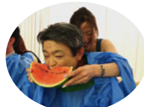
さあさ 召し上がれ