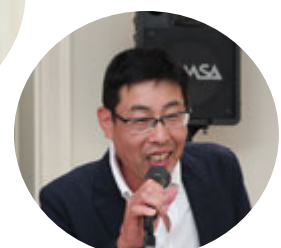
皆さん お楽しみ いただけましたか？