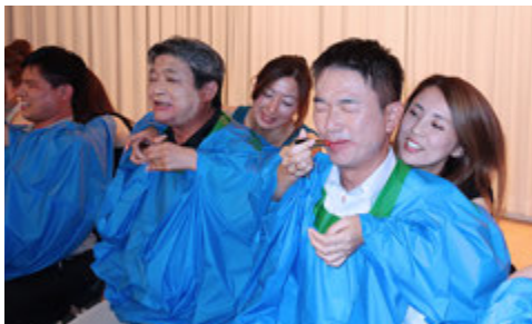
さあ綺麗になりましょね