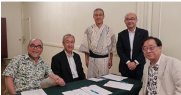
関所は例会運営委員会