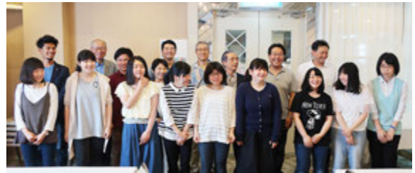
何やら楽しそうです