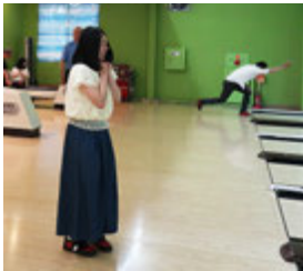
ピンに当たるかしら?