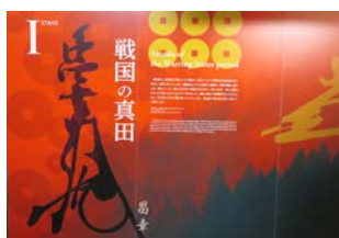
まずは真田宝物館