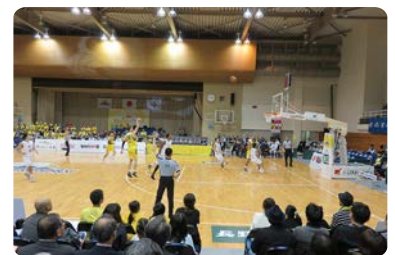
信州ブレイブウォリアーズ試合観戦