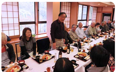
みなさんお疲れ様でした!