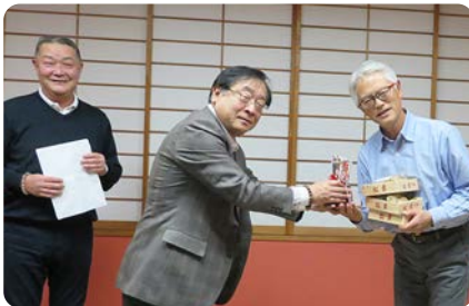
優勝おめでとうございます