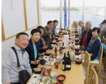
小名浜港にて昼食