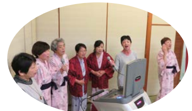
♪評判良かったです♪