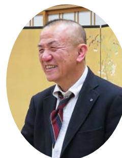
高井会員家族委員長