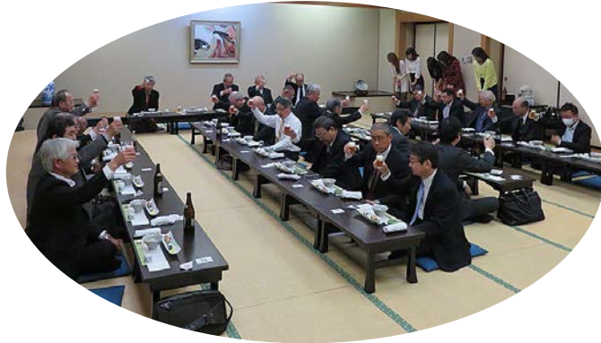
お席はクジを引いていただきました