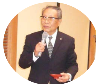
西クラブのますますの繁栄を祈って 乾杯！